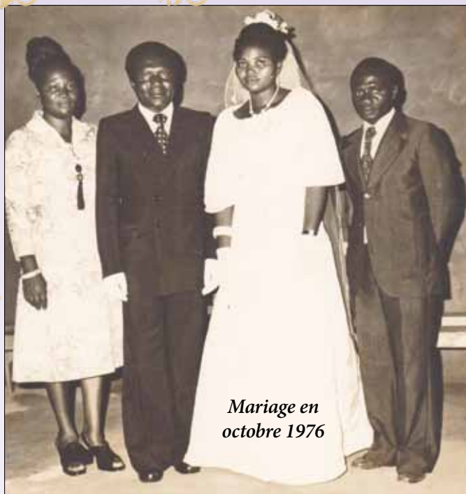
Mariage en octobre 1976