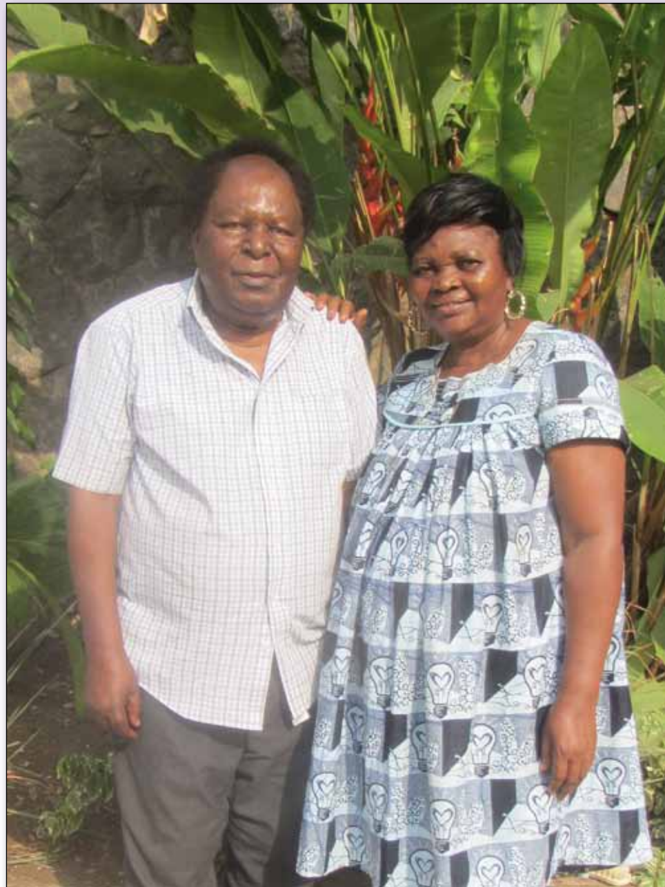
Souvenir de l'anniversaire de ses 80 ans en février 2017.