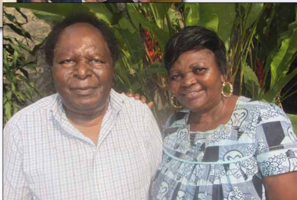
Le jour de ses 80 ans.