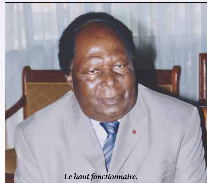
Le haut fonctionnaire.