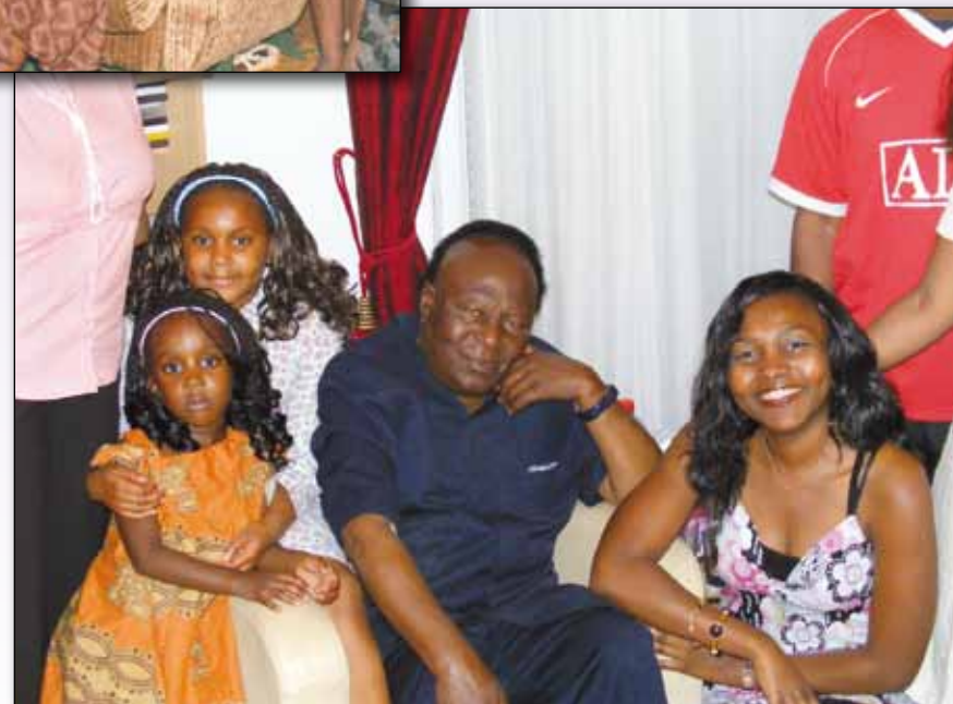
Avec quelques petits-enfants à Paris en 2009.