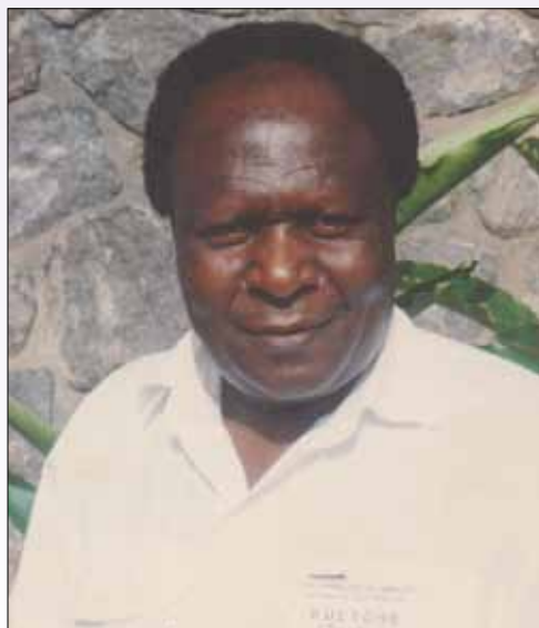
L'Ancien d'Eglise, en avril 1992.