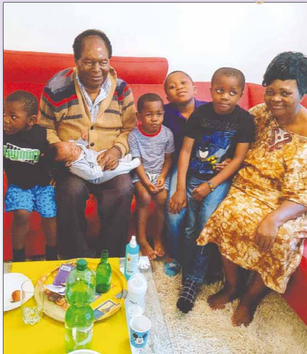
En compagnie de quelques petits-enfants en Allemagne en 2017.