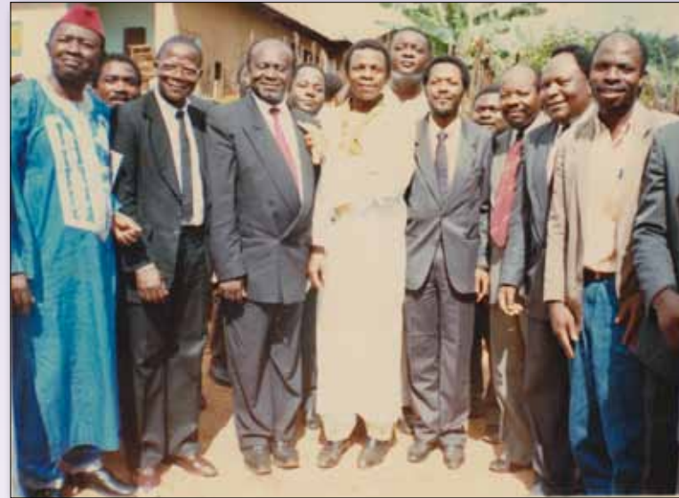
En compagnie de plusieurs amis lors d'une cérémonie à la fin des années 80.