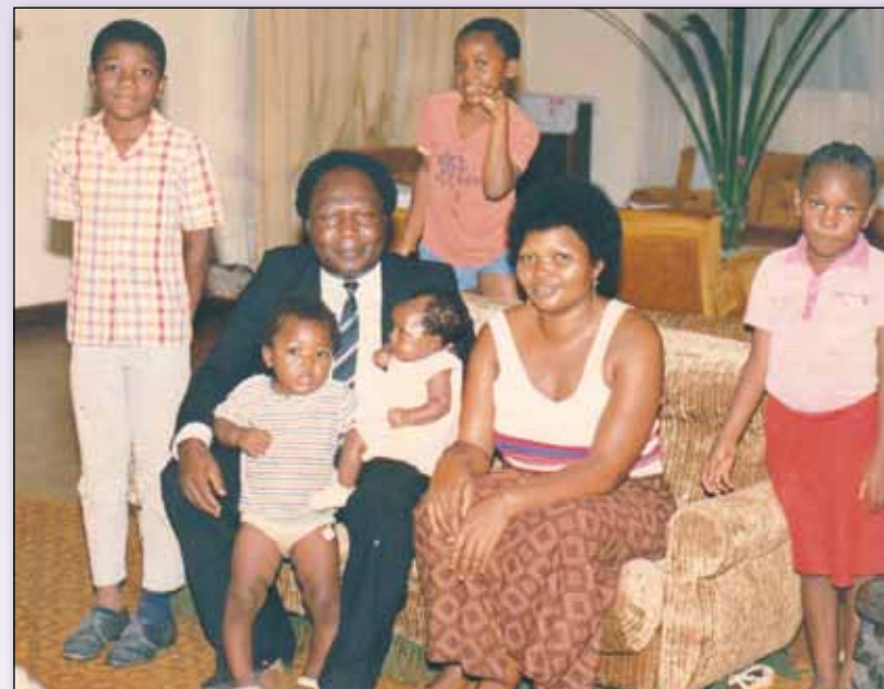
Avec les enfants en 1986.

« C est avec un cœur attristé que je t'écris ces derniers mots. La vie m'a fait un des plus beaux cadeaux, celui d'avoir un papa exceptionnel. Toutes ces années passées en ta présence m'ont rendue aussi respectueuse, observatrice et surtout aussi prudente que toi papa. Malheureusement tu me laisses en début-parcours de ma vie. Je ne sais pas ce que ma vie deviendra sans toi, mais je sais au moins une chose, c'est que tu guideras chacun de mes pas afin que je devienne quelqu'un d'aussi important que toi et à ton image. Je n'en aurais jamais un autre comme toi papa. Que le SEIGNEUR veille sur toi. Adieu papa !