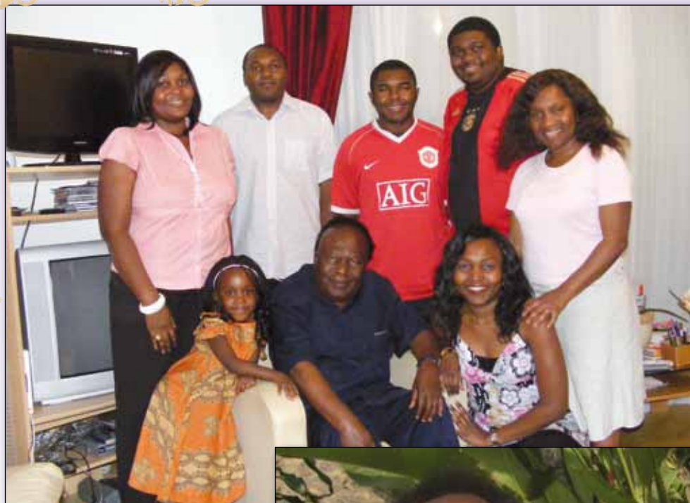
En famille à Paris en 2009.