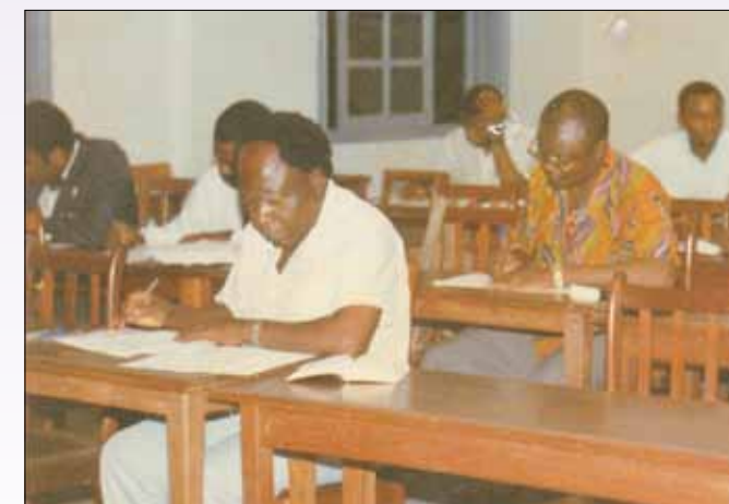
Etudiant assidu à l'Université protestante d'Afrique centrale (UPAC) à Yaoundé (1992).